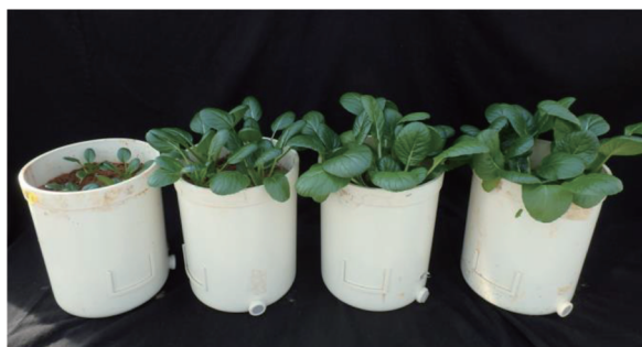
リン酸イオン吸着剤と市販肥料との小松菜の比較試験 (左:リン無し、中央2つ:リン酸イオン吸着剤を施肥、右:通常リン肥料を施肥)